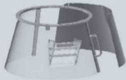
Protezione fissa/girevole in plastica "F" Fixed rotating plastic safety guard "F"